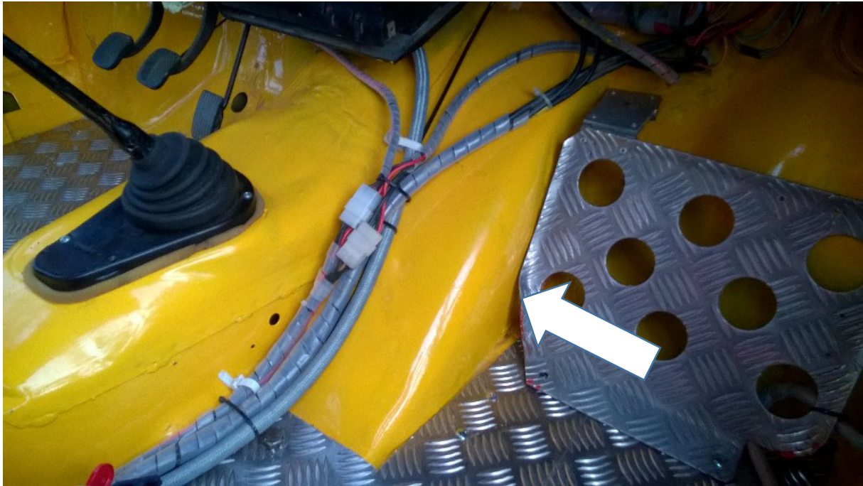
Obr. TI - 2